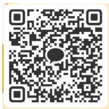
語学院公式カカオトーク