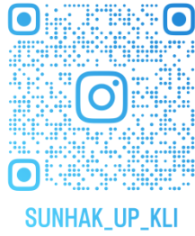
語学院公式インスタグラム